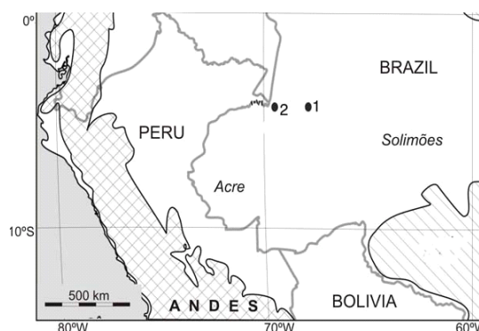
Figura 1. Localização dos dois poços de sondagem estudados: 1) 1AS-27-AM e 2) 1AS-19-AM.

As amostras foram preparadas utilizando-se os métodos empregados por Traverse (1988). Uma lâmina palinológica foi confeccionada por amostra e cerca de 300 grãos de pólen e esporos foram contados. A afinidade botânica desses grãos foi comparada com a literatura (Absy, 1979; Roubik & Moreno, 1991).