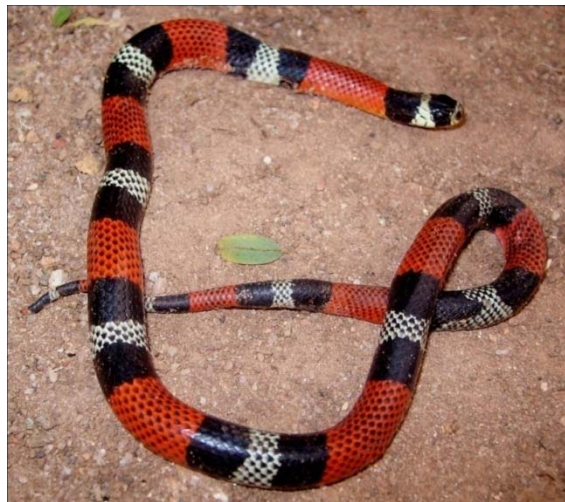
Figure 1. Erythrolamprus aesculapii : male, SVL = 340.0 mm, tail length = 55.0 mm, head length = 12.5 mm, mass = 14.2 g.