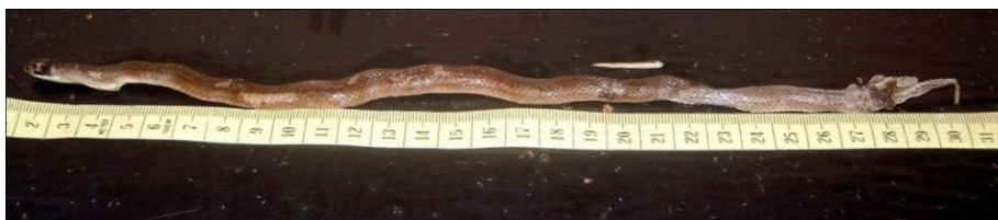
Figure 2. Taeniophallus affinis : SVL = 294.0 mm, tail length = 10.0 mm + n, head length = 11.6 mm, mass = 8.7 g.